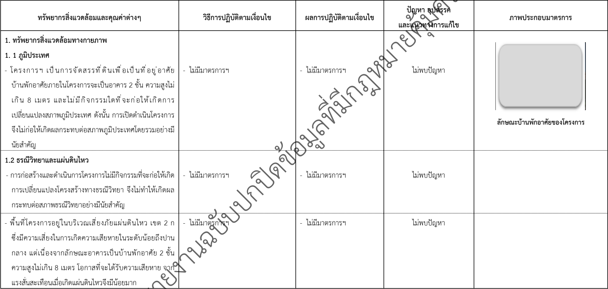
ตารางที่ 2-1 สรุปผลกระทบสิ่งแวดล้อมที่สำคัญและการปฏิบัติตามมาตรการป้องกันและแก้ไขผลกระทบสิ่งแวดล้อมและมาตรการติดตามตรวจสอบผลกระทบสิ่งแวดล้อม (ระยะดำเนินการ) โครงการเพอร์เฟค พาร์ค พระราม 5-บางใหญ่ ตั้งอยู่ที่ ตำบลบางแม่นาง อำเภอบางใหญ่ จังหวัดนนทบุรี