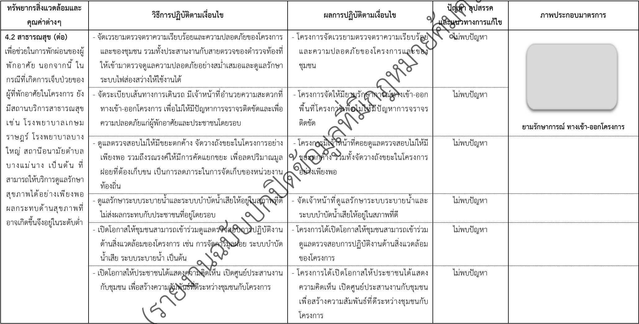
ตารางที่ 2-1 สรุปผลกระทบสิ่งแวดล้อมที่สำคัญและการปฏิบัติตามมาตรการป้องกันและแก้ไขผลกระทบสิ่งแวดล้อมและมาตรการติดตามตรวจสอบผลกระทบสิ่งแวดล้อม (ระยะดำเนินการ) โครงการเพอร์เฟค พาร์ค พระราม 5-บางใหญ่ ตั้งอยู่ที่ ตำบลบางแม่นาง อำเภอบางใหญ่ จังหวัดนนทบุรี (ต่อ)