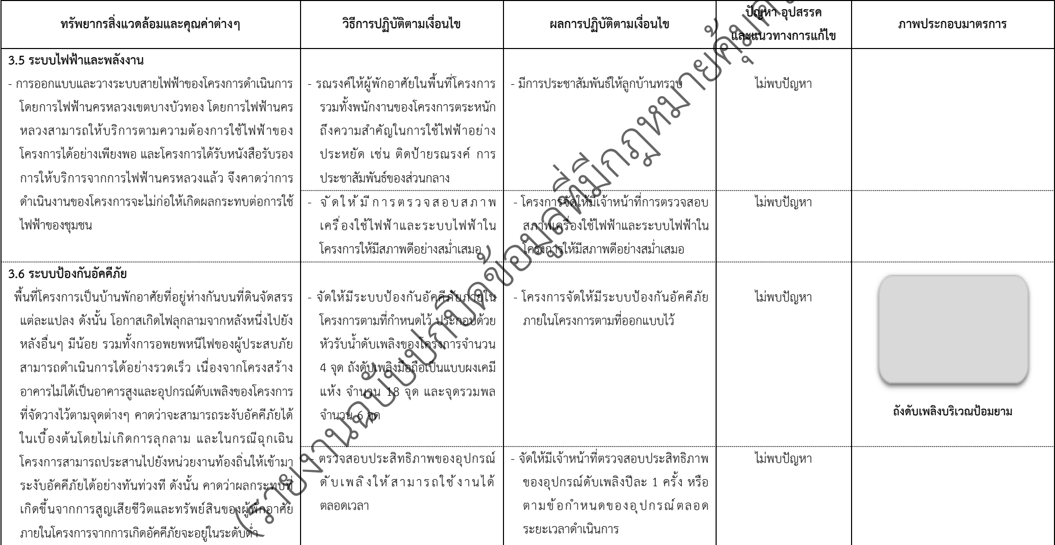
ตารางที่ 2-1 สรุปผลกระทบสิ่งแวดล้อมที่สำคัญและการปฏิบัติตามมาตรการป้องกันและแก้ไขผลกระทบสิ่งแวดล้อมและมาตรการติดตามตรวจสอบผลกระทบสิ่งแวดล้อม (ระยะดำเนินการ) โครงการเพอร์เฟค พาร์ค พระราม 5-บางใหญ่ ตั้งอยู่ที่ ตำบลบางแม่นาง อำเภอบางใหญ่ จังหวัดนนทบุรี (ต่อ)