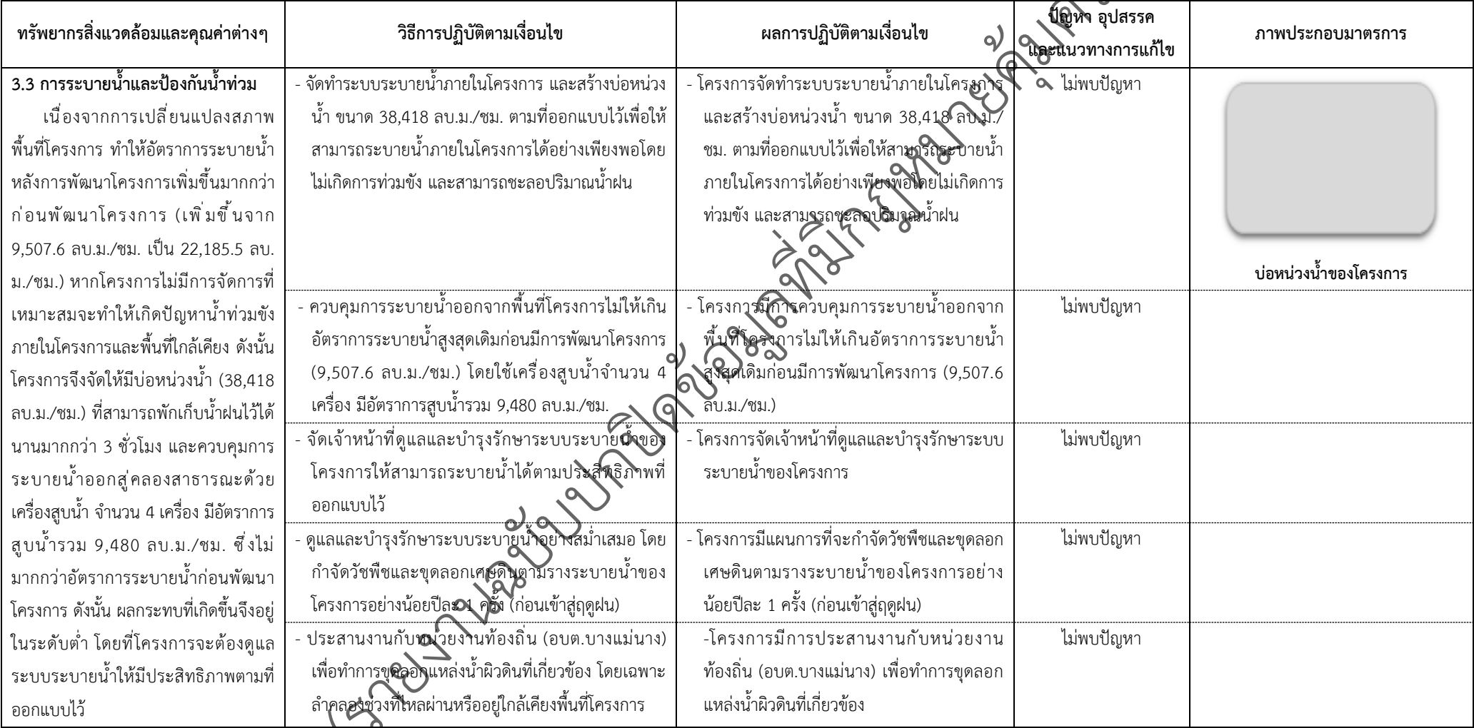
ตารางที่ 2-1 สรุปผลกระทบสิ่งแวดล้อมที่สำคัญและการปฏิบัติตามมาตรการป้องกันและแก้ไขผลกระทบสิ่งแวดล้อมและมาตรการติดตามตรวจสอบผลกระทบสิ่งแวดล้อม (ระยะดำเนินการ) โครงการเพอร์เฟค พาร์ค พระราม 5-บางใหญ่ ตั้งอยู่ที่ ตำบลบางแม่นาง อำเภอบางใหญ่ จังหวัดนนทบุรี (ต่อ)